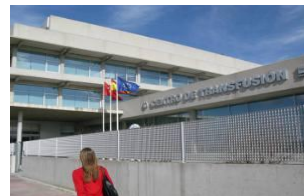
Centro de transfusiones de la C. de Madrid

La primera medida que ambas empresas de gestión que ambas empresas han puesto sobre la mesa ha sido clara, fijar una drástica reducción salarial del 46%. Los trabajadores cuentan con dos posibilidades: La primera posibilidad es que lo acepten y mantengan sus puestos de trabajo cobrando poco más de 600 euros. La segunda posibilidad es que lo rechacen y entonces se arriesgan a ser trasladados o despedidos.